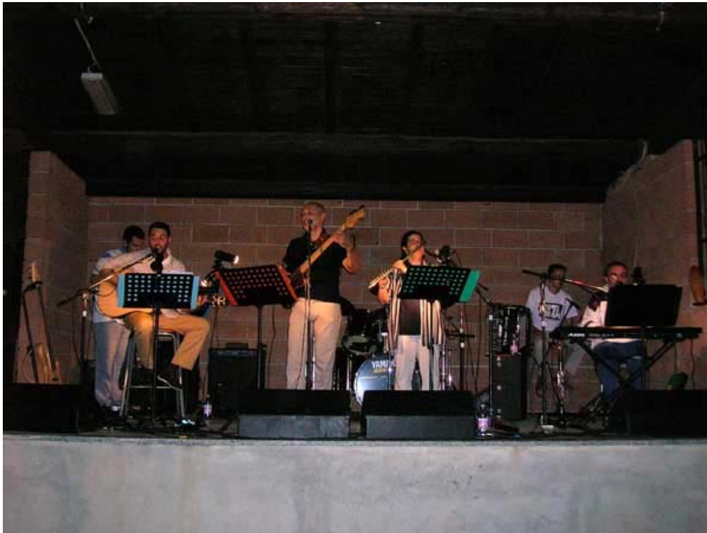
The Spoon River Band ed il loro CD